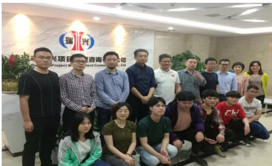
建筑学院教师赴武汉瑞兴项目管理咨询公司开展顶岗实习巡查调研