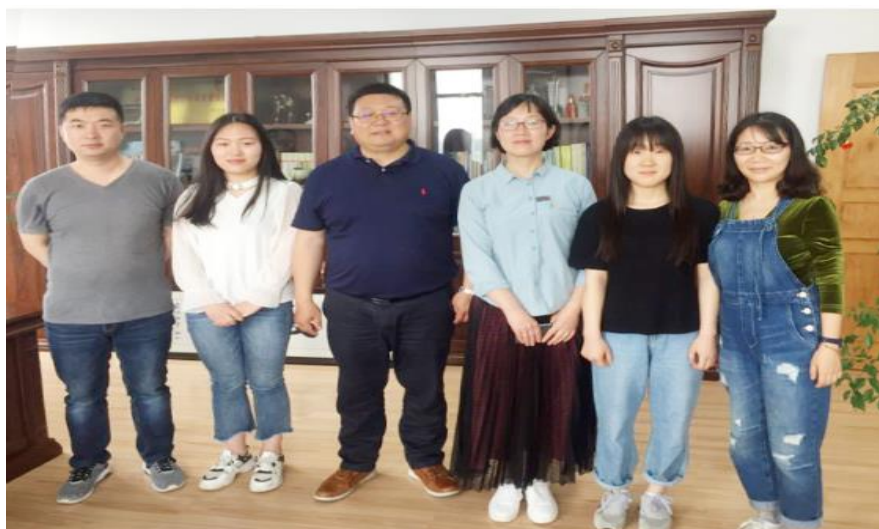
建筑学院教师赴武汉文华系统工程公司开展顶岗实习巡查调研